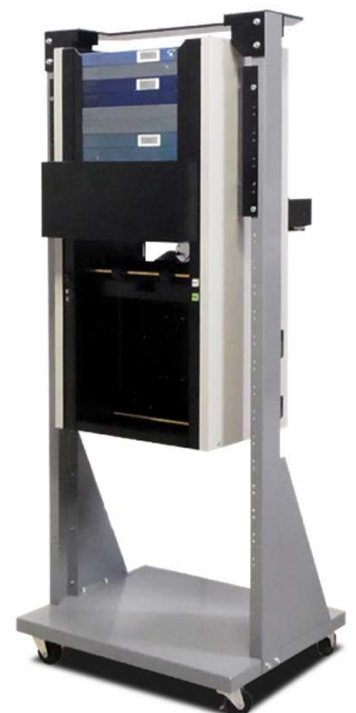
ローダーラック搭載イメージ