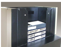
Sカセットホルダー装着イメージ